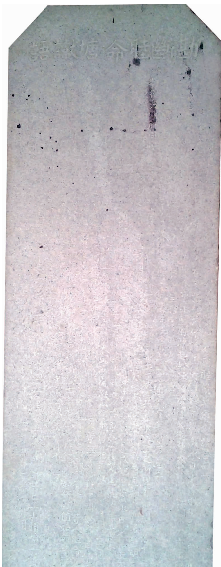
这块清代碑刻距今已有200多年的历史