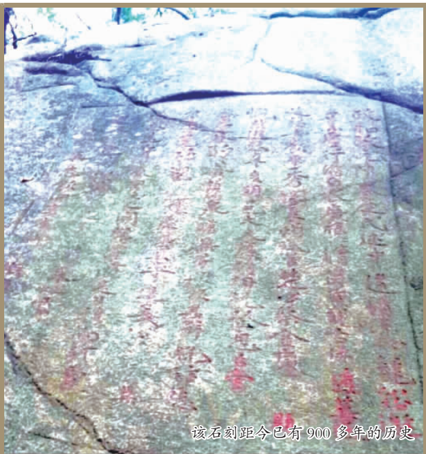
该石刻距今已有900多年的历史