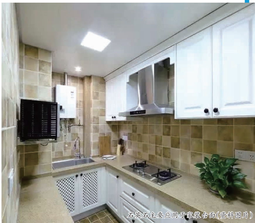
石英石主要应用于家装台面(资料图片)

但目前这个行业相对分散,仅中国就有 500 多家相关企业,可谓“遍地开花”,在厦门同安、南安水头、广东佛山、广西贺州、河南信阳以及山东省的部分县市,石英石企业较为集中。但从企业规模来看,绝大多数的企业产值都未能突破 3 亿~5 亿元,规模都不是很大。