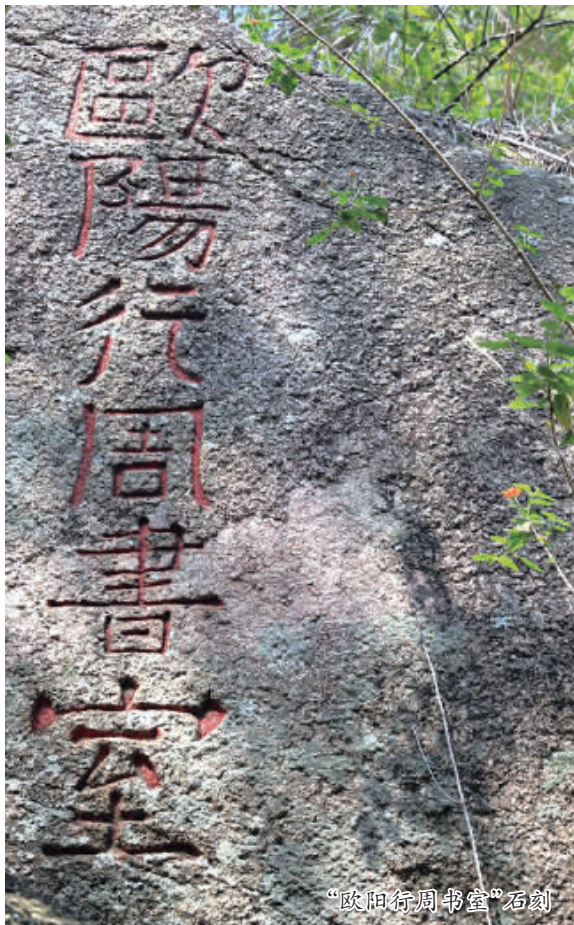
“欧阳行周书室”石刻